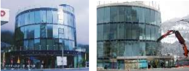
Blue-Tower St. Johann/Pg. – 1.100 m 2

Referenzen: Signapur -Glasoberflächenveredelung