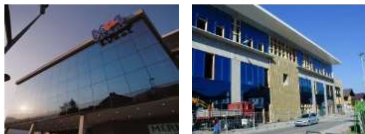
Einkaufszentrum M4 Wörgl – ca. 1.100 m 2