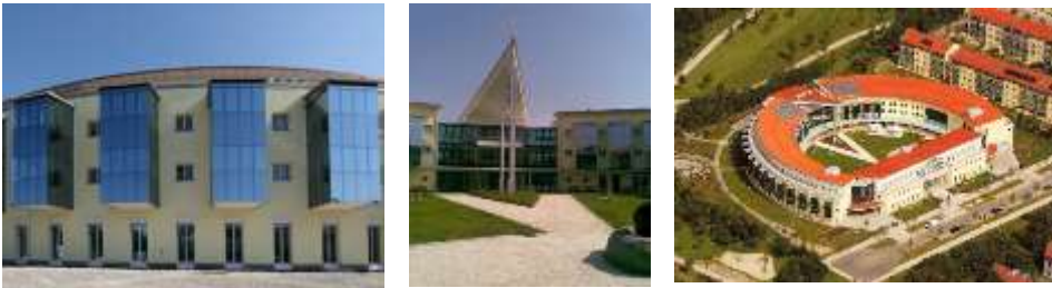
Mutterhaus „Berg am Laim“ München – ca. 3.000 m 2